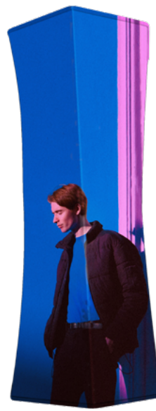
TORRE HEXAGONAL SKU: 175-400