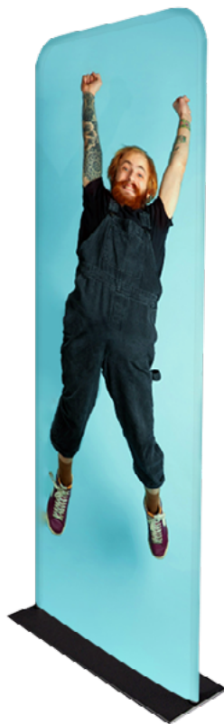
TÓTEM TELA TUBO ALUM. SKU: 174-130