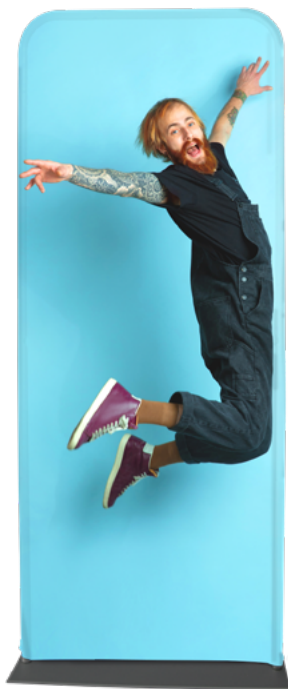
TÓTEM TELA TUBO ALUM. SKU: 174-120

El tótem tubular es un práctico aliado para transmitir un mensaje. Su elegancia, tamaño, facilidad de armado y de transportación son ideales para impactar visualmente. Se cuentan con dos tipos de siluetas a elegir, dependiendo la imagen que se desea proyectar al usuario, en caras planas o con curvatura, cada modelo cuenta con diferente soporte.