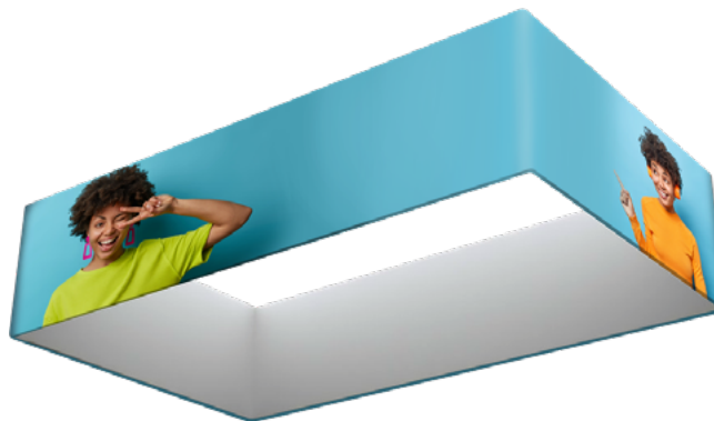
COLGANTE RECTANGULAR SKU: 177-400