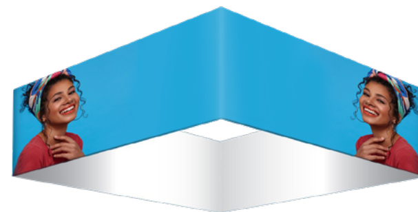
COLGANTE CUADRADO SKU: 177-200