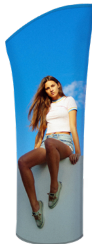
TORRE TUBO 1/2 ARCO SKU: 175-350