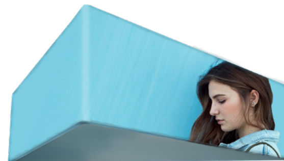
COLGANTE TRIANGULAR SKU: 177-540