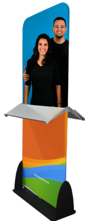
KIOSKO CON FOLLETERO 2V SKU: 176-300