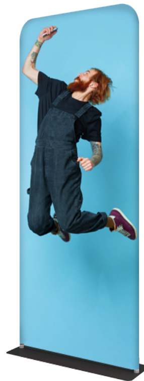
TÓTEM TELA TUBO ALUM. SKU: 174-140