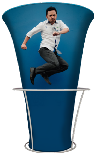
TORRE CIRCULAR PARA ROPA SKU: 175-200