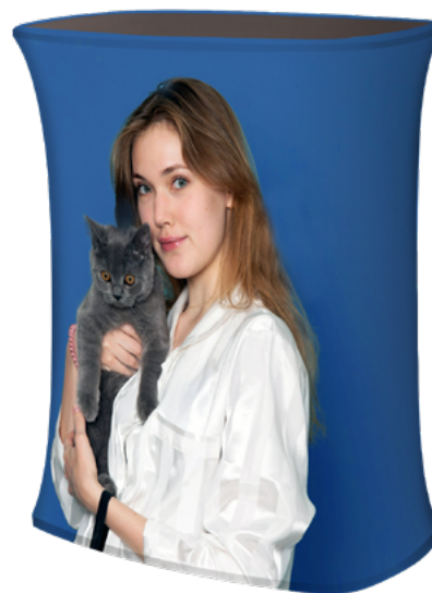
MESA TELA CUADRADA SKU: 172-110