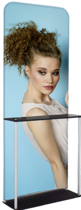
KIOSKO CON MESA SKU: 176-200