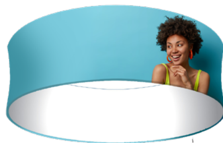
COLGANTE CIRCULAR SKU: 177-100

En recintos grandes, es importante destacar una marca o un espacio determinado a distancia, la instalación de un colgante con tela es una solución a esta necesidad. Para elegir la forma adecuada del colgante, dependerá de los ángulos de los que se desea visibilidad, así como la altura entre el techo y el exhibidor para lograr un equilibrio de elementos.