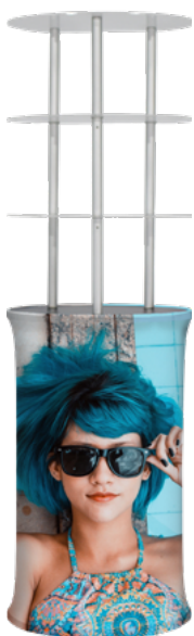
KIOSKO OVAL CON REPISA SKU: 176-100

Se presentan soluciones para exhibir productos y colocación de documentos (folletos, solicitudes, formularios, etc.), acompañados de un gráfico que refuerza el mensaje de marca. La elección dependerá del tipo de elemento a mostrar, del espacio disponible para la instalación (área interior abierta, paredes, etc.) y del área visual requerida para el gráfico.