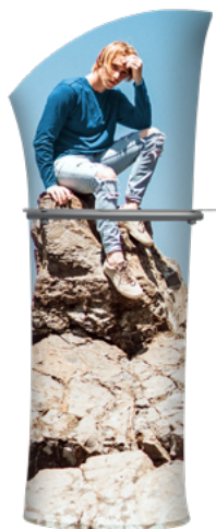
TORRE 1/2 ARCO C/REPISA 2V SKU: 175-100

Las torres aquí mostradas son elementos visualmente impactantes, permitirán que el gráfico sea visible desde varios ángulos, todas sus caras cuentan con espacio para imagen. Para la elección de la torre ideal, es indispensable identificar el espacio físico en el que se instalará así como la altura disponible para que pueda ser apreciada adecuadamente.