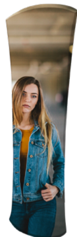
TORRE TUBO CON ARCO SKU: 175-300