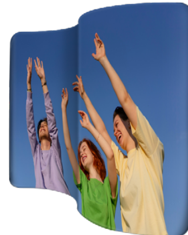
BACK CURVO TELA S SKU: 173-31S

Medidas en centímetros | Pesos en kilogramos