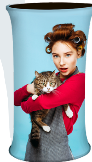
MESA TELA OVAL SKU: 172-120