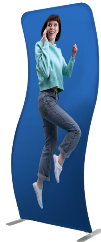
TÓTEM TELA TUBO SNAKE SKU: 174-160

Medidas en centímetros | Pesos en kilogramos