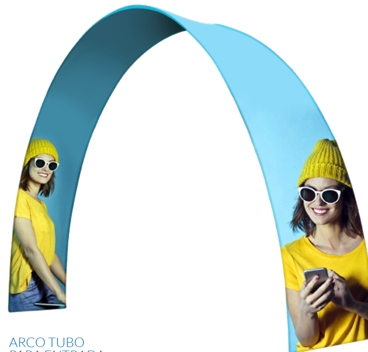
ARCO TUBO PARA ENTRADA SKU: 175-600

Medidas en centímetros | Pesos en kilogramos