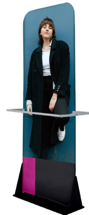
KIOSKO CON PERCHERO 2V SKU: 176-400

Medidas en centímetros | Pesos en kilogramos