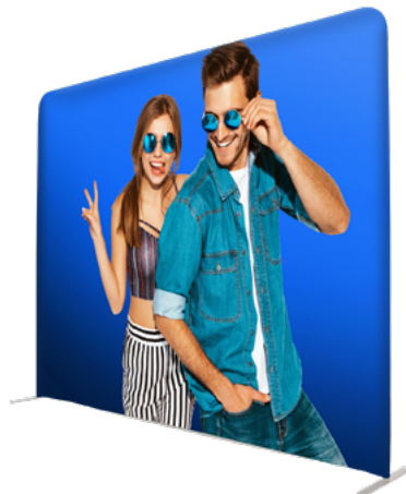
BACK RECTO TELA TUBO SKU: 173-24R