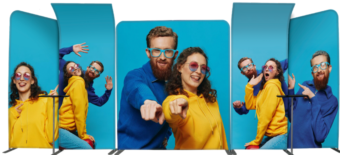
BACK RECTO TELA 5 PIEZAS SKU: 173-60R