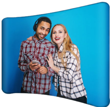
BACK CURVO TELA TUBO SKU: 173-226

Son displays altamente funcionales. El gráfico se muestra en un cara, con opción a incluir gráfico en la parte posterior, reforzando el mensaje a transmitir. Para la elección de la forma y tamaño, es recomendable evaluar el entorno y el impacto que se desea, seleccionando un modelo recto o curvo, así como el espacio y tiempo disponible para su ensamble.