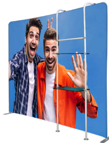
BACK RECTO TELA C/REPISA SKU: 173-30CR