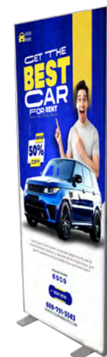
CAJA DE LUZ EXPOLUMINIA