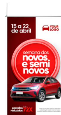
BANNER HANGER SKU: 134-013 15 x 100 cm