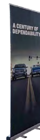
ROLL-UP 1 V STD