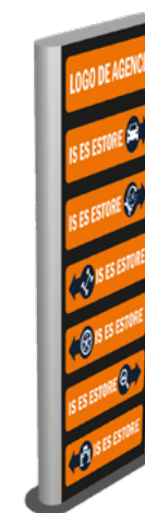
TÓTEM HF120 SKU: 328B- Varios tamaños