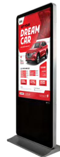
TÓTEM LCD TOUCH SCREEN 55"