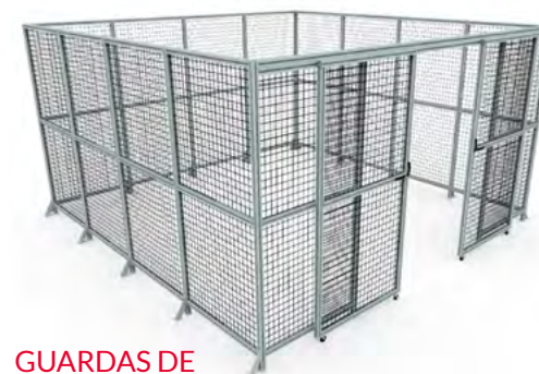
GUARDAS DE PROTECCIÓN