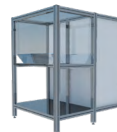
MESA DE TRABAJO