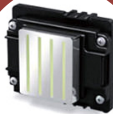
Cabezal EPSON XP600