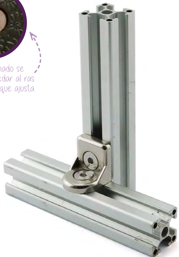
Medidas en milímetros (mm)

El tornillo avellanado se hunde hasta quedar al ras en la superficie que ajusta.