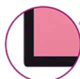
MARCO EN ALUMINIO